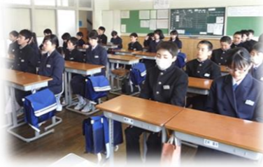
本校の特色ある活動は、学校目標の具現化に有効であると思いますか。

◇朝の読書や自問の時間など、1日のうち1～2回心落ち着かせる時間があるのは良いことだと思います。 ◇どれも良い活動だと思います。子どもたちが今やらされているだけだとしても、5年先10年先に必ずわかると思います。 ◇校門での一礼は学校に感謝の思いが表れていてとても良いと思います。 ◇ランチルームで皆で食べることにより心豊かに伸びているような気がします。 ◇意味を理解し行動できているかが問題です。1つ1つにはそれぞれやる意味があるので1人1人やる気あつての行動だと良いです。