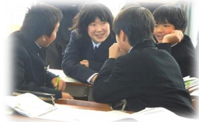
生徒が前向きに活動し、楽しそうな授業が行なわれていると思いますか。

◇参観日の様子では自分の意見を発表し、友達とも関わり合いながらほかの意見にも耳を傾け取り組んでいたのが楽しそうな授業が行われていると思いました。 ◇クラスの雰囲気もよく、先生に質問したりする様子を見ると楽しく授業が行われているようです。 ◇参観日で英語の授業を見たときはほとんど英語で会話をしながら楽しそうだなと思いました。(昔の読み書き中心な授業とはちがいますね) ◇ただ、挙手もせずムダな発言をする子が目立ちます。他の子の集中力や意欲を失わせる行為に見えます。厳しく注意してもいいのではないかと思います。 ◇集中したくても騒がしい生徒がいるため、授業が聞こえない時があるようです。 ◇わからない子はそのままおいていかれそう。 ◇私語を注意されても平気である先生の問いかけにため口で答えるなど、楽しそうな授業をする以前の状態にびっくりしました。