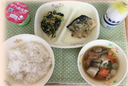
おいしそうな風邪予防献立