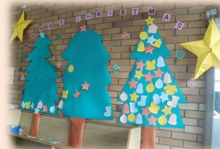
おすすめ本の紹介コーナー