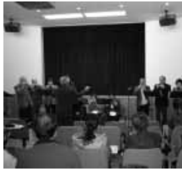
▲全員で心をこめて「埴生の宿」を演奏

二十年度公民館の分館事業に むけ、第一回分館長主事・体育 部長会が一月十一日に開催。本 年は役員三十三人のうち二十三