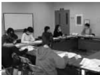
地域全体の問題としてみんなでこの問題を考えようと、さまざまな立場、年代のメンバーが集まって活動をしています。

「まず、この状況をキチンと理解すること。そして理解する人を増やすこと。理解する人が多くなることで状況が変わるかもしれない。大きな力になるかもしれないから。」