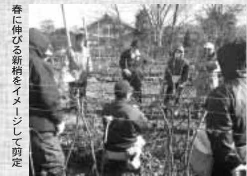
春に伸びる新梢をイメージして剪定

宮田ワイン「紫輝2007」の解禁から2ヶ月余り。年末年始には、紫輝で乾杯をされた方も多いことでしょう。さて、2007年の収穫を終えたヤマ・ソービニオン畑では、すでに今年の生産に向けての作業が始まっています。駒ヶ原からの寒風吹く中、ヤマ・ソービニオンの剪定講習会が行われました。樹の勢いも樹齢とともに強まり、果実と樹の成長とのバランスが栽培上とても重要になってきました。春に伸びる新梢をイメージしながら剪定ばさみを入れいきます。今年の「紫輝づくり」の始まりです。