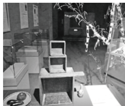
▲資料館に飾られた七夕飾り

公民館に併設された向山雅重民俗資料館の展示室に、8月26日(旧暦7月7日)を前に七夕飾りがお目見えしました。同館では、この二十日ほど前の8月4日(同6月14日)に、江戸時代にその日に行われていたはずの祇園祭の宵祭りに合わせて、津島神社の大提灯を展示しており、このあと10月3日の十五夜のお月見、10月30日の十三夜のお月見と続き、来年2月13日の旧暦の大晦日には、歳神様をお迎える準備が整えられるのです。