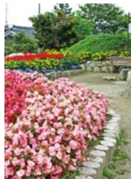
広場は『輪苑』と名付けられ憩いの場となっている。

明治39年、中央線の八王子・塩尻間が開通すると、伊那電車軌道（のちに伊那電気鉄道と改称）により辰野から伊那谷を南下する路線が計画されました。明治41年に始まった工事は少しずつ南下、宮田に電車を迎え入れたのは大正2年12月でした。翌年には赤穂まで開通しますが、当時は宮田・大田切間に「駒ヶ原停留所」もあったそうです。また、電力が少なかったため発電所の開発も進められ、太田切発電所もこの頃運転を開始しています。