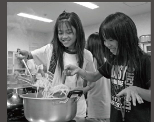
買い物も調理も自分たちで！上手にできた！