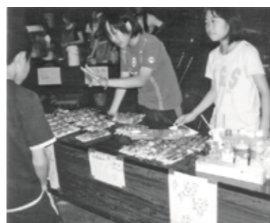
▲おいしい五平餅をどうぞ!

「礼儀作法と世界のお茶を楽しむましよう」という講座は、畳の部屋が少ない日常生活の中、戸のあけ方・座り方・おじぎの仕方・客のもてなし方を知り、さらに、日本や世界のいろいろなお茶、各国の楽しい飲み方、お菓子について学び、季節に合わせて楽しんでいます。