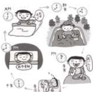
生活のリズムをつけるのは親の役目。規則正しいリズムをつくってあげましょう。

生活リズムを整える3要素とは・食事・遊び・睡眠です。食事は1日3食きちんと決まった時間に食べることが必要です。特に朝食はその日のエネルギーを補給する役割があります。十分に補給されれば、1日楽しく元気に遊ぶことができます。子どもにとって遊