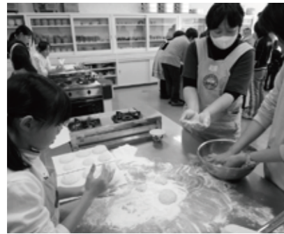
▲鏡餅 上手に形ができたかな

見聞きすることを大切にしました。土のぬくもりに触れ、大地に育まれる尊い生命を慈しみながら、かかし作りに始まり、野菜の種まきや収穫、田植えや脱穀、炭焼き、りんご狩り、クルマ拾い、さらに、今年は本陣にて歴史の学習や障子貼り、流しそうめんに挑戦し、宿泊体験も行いました。