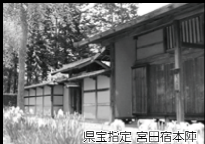
県宝指定 宮田宿本陣

文化財は国民共通の財産です。文化財の火災は放火や周囲からの飛び火によるものが多く、火災による焼失から守るためには地域の協力が欠かせません。みんなで協力して貴重な財産を後世へ残しましょう。