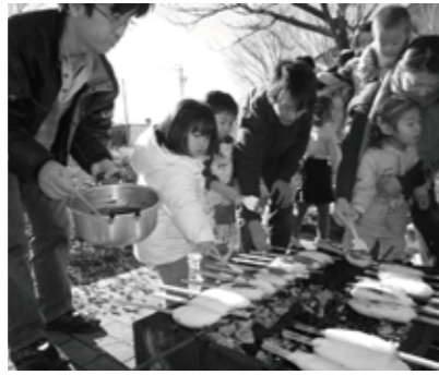
▲炭火を使って五平餅を焼きました

親子体験活動事業としてスタートして3年。毎年、8回の講座を開催し、身近な自然とのふれあい体験を通して、働く喜びや命の尊さ、感謝の心、そして、人と人の交流の大切さなど、親子でたくさん学び合うことができました。 各講座とも、季節や農作業の移りゆきに合わせて、できる限り生の自然を自らの手で触れ、