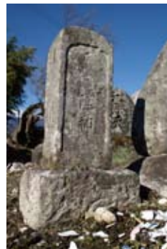
道陸神の碑。手前に割れた茶碗が残っている。

道祖神を意味する「道陸神」の碑が建てられたこの場所は、今でもその名のおり「道陸神の辻」と呼ばれています。宮田村には全部で23の道祖神がありますが、この大久保のものは上伊那でも最も古いものの一つといわれています。塞の神ともいわれる道祖神は、集落の入口にあつて外から来る災いを追い払い、村を守ってくれると言われています。また、子どもと親しい神様で、正月のどんど焼きは、この神の祭として子どもたちによって行われています。小正月の14日の夜、厄年の人は、普段自分が使っている茶碗に小銭や大根の切ったものを、自分の年の数だけ入れて道祖神に投げつけ、壊すことにより厄落しをします。振り返ると厄がついて来てしまうので、投げつけたあとは、後ろを振り返らずに帰らなければいけないのだそうです。