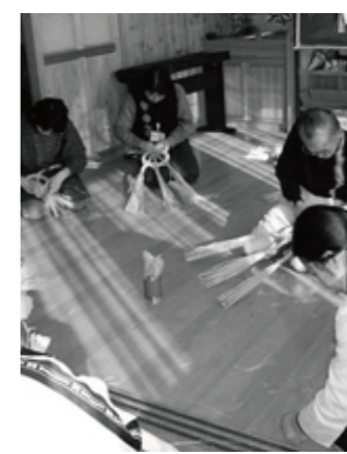
よい年でありますように