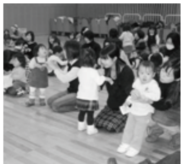
▲ママと一緒に楽しいリトミック

「リトミック」を開きました。おなじみのクリスマスソングの軽快なリズムに合わせて、親子みんなで歌い、元氣よく輪になって踊り、年間8回の教室を賑やかに締めくくりました。