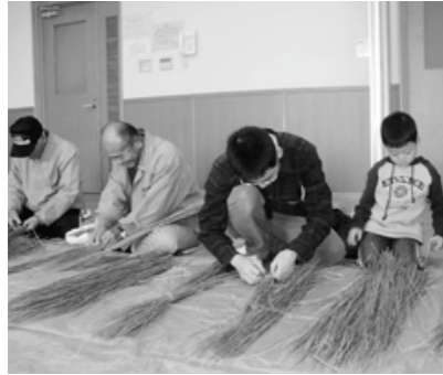
▲良い年を願いながら

しめ縄、しめ飾りは、新年に家の入り口や神棚などに取り付けて、災いを防ぐというまじないの意味があるそうです。参加者は、新しい丑年こそ、それぞれの家庭にとって、また、村にとって、明るい年となりますようにと願いをこめながら、心のこもった手作りのしめ縄、鯛、オヤスなどを編みあげました。