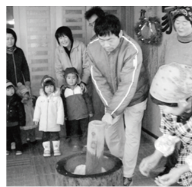
掛け声かけてべったんべったん

12月22日(月)餅つきをしました。地域の皆様、小さい子どもさんを連れた若いお母さんなど40名の参加がありました。小さな子どもさんも杵を持ち、べったん、べったんとつきました。『お供え』を取りあんど、黄な粉、からみもちにしていたいただきました。皆様のご協力有難うございました。