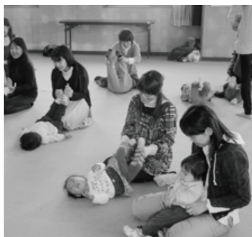
▲スキンシップに大よろこび

昨年12月1日、MMC（みんなのミュージックサークル）の皆さんをお迎えし、クリスマス観賞会「親子deコンサート」が開かれました。手遊びに始まりスキンシップをとりながらお母さんのやさしい歌声の子守唄。美しいフルートやピアノの音色に目を輝かせる子どもたち。