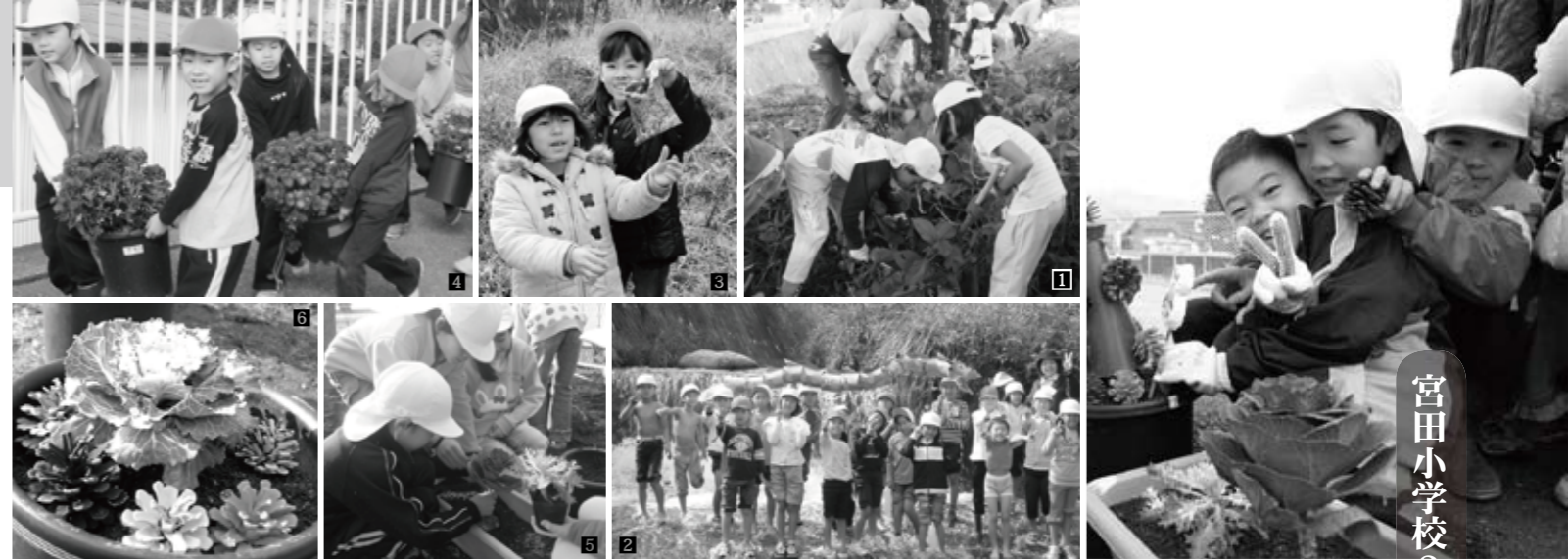
1町3区の草刈り作業に参加 2みんな川が大好き 3ゴミを捨てないで！ 4秋の花は菊 56冬の花は葉牡丹