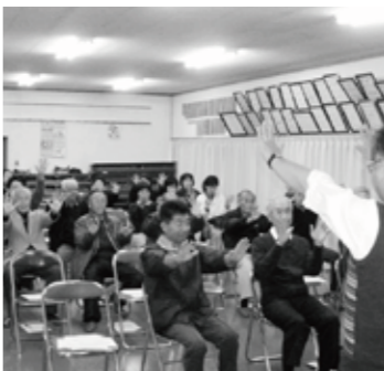
▲ワークショップで学びあう (大原分館)

☆スキークラス 2月7日(土) 駒ヶ根高原スキークラブ 費用 一人 3000円(フット、昼食代、保険料、用具等別途負担) 村在任在勤者で小学3年生以上 申込 公民館(85-2314)