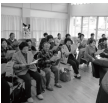
▲元氣よく唱歌を歌う学級生たち