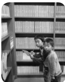
▲図書館内を探検だ！（クイズ）