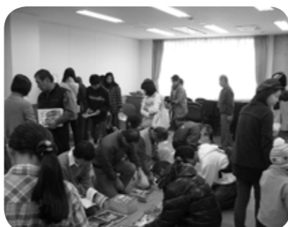
▲古本・雑誌の無料頒布会