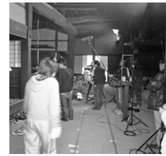
映画のロケに使われました(11月)

■日常的に開館するのは原則として4月から11月までとしますが、事前に申し込みがあれば冬期でも随時開館します。