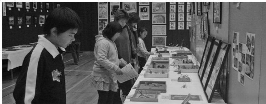
▲力作がそろった展示発表会 出品数 1045 点 / 入場者 1281 人