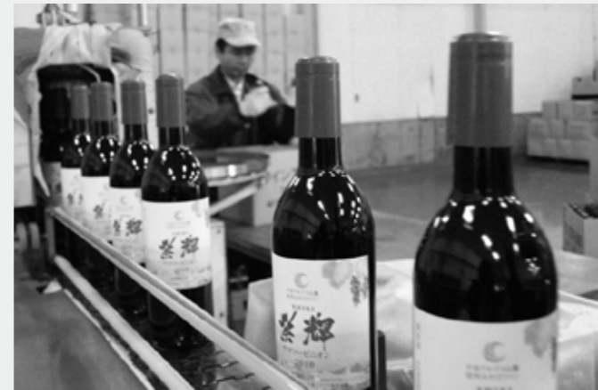
発売を間近に控えて瓶詰め作業（12月3日）