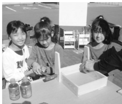
▲木工広場で「椅子」づくり

村民会館では、芸能発表が二日間に渡って催され、各種のグループが日頃の活動の成果を発表。歌、琴、太鼓、少林寺、空手、舞踊、エアロビなどで、多くの観客を魅了しました。その他の企画では、菊花展、淡水魚展、木工広場、子ども茶室、分館報展、文化財企画展、習字展、そして、宮田村下在地押絵図の展示など、様々な展示で盛り上がりしました。