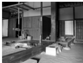
囲炉裏や土間のある母屋