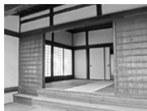
客人を迎える座敷棟の玄関