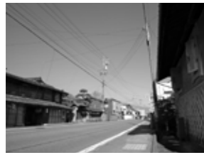
本陣のあった仲町交差点北