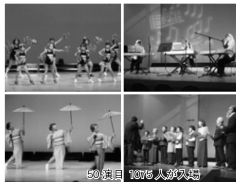
50 演目 1075 人が入場