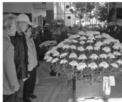
▲エントランスホールの菊花展 (120 鉢)

11月6、7日、好天に恵まれ、第37回宮田村文化祭が盛大に開かれました。体育センターでの作品展では、分館長・主事・グループ代表の方々によって整えられた会場に、絵画、書道、手工芸、生け花、学校週5日制講座などの力作が所狭しと並び、大勢の参観者が訪れました。