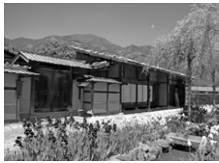
当時の街並みとともに復元されている

■これまで本陣には、ここに本陣があることがわかるような看板などは何もありませんでした。そこで、施設入口に建物にふさわしい案内看板を設け、主な道路や菅の台方面にも本陣へ誘導するような看板を設置するとともに、宿場町（現在の旧道仲町付近）へ本陣があった場所がわかる表示をしていきます。