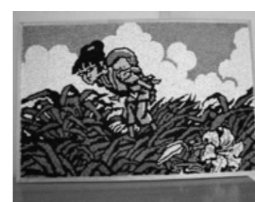
▲輪のように丸めた色画用紙を貼り付けてあります