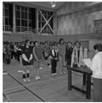
▲女子バレーボール閉幕式