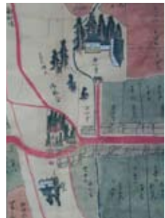
江戸天保期の「宮田村下地押絵図」には「堂」と表記され現在の津島神社の位置に描かれている。

小学校正門の南側にある観音堂と呼ばれるこのお堂、建物は近年になって建替えられたもので、江戸時代に建てられた観音堂は、現在の津島神社の位置にありました。