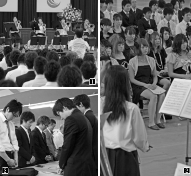
1先輩をお祝いする演奏でスタート 2後輩たちの演奏に聴き入る新成人 中にはかつてこの成人式で自分が演奏した人も 3この日は終戦記念日 昼食会の前に全員で黙祷