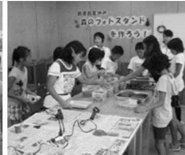
▲いろいろな木の实があるね!

「今日図書館に行く？」と何を借りようかすでに考えた顔で息子が聞いてくる。最初は私が選んだ本を借り読んでいた。いつの頃から自分の本は自分で選んで借りるようになった。親が知らない世界をいつの間にか作っているような気がした。興味を持った本を手にした嬉しそうな顔はあの頃と変わらない気がする。本屋や古本屋とは違い、すぐ手にして見る事が出来るのが図書館の魅力だと思う。好奇心は色んな所に向けて欲しい。本はその手助けになる。色んな本を読んで育てて欲しい。