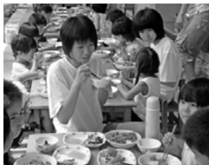
写真上：中央保育園 給食の準備を園児といっしょに食事 写真左：北消防署 救助訓練も体験 写真右：宮田自動車 説明を受けながら実際に車の整備 ※これらの写真も中学生が撮影してくれました