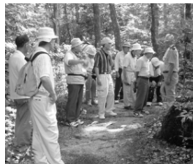
▲ガイドの説明を聞く会員たち

砂防情報センターを起点に御座石、切石、重石、地蔵石、袋石、光前寺、大沼池、駒ヶ池、水と文化の森公園など、専門のガイドの説明を聞きながら巡りました。身近な地域の自然の営みや歴史文化を知る、大変よい研修になりました。