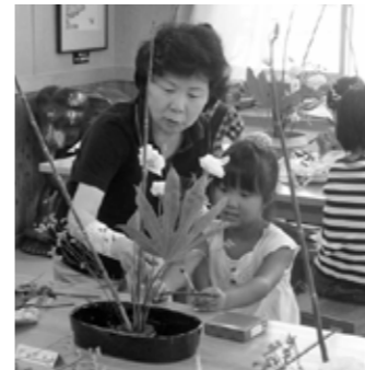
▲お花の気持ちを活けるのヨ