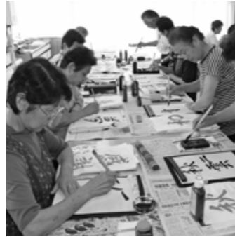
▲とめ、はね、払いに気をつけて

楽器を使った合奏にも挑み、音を合わせる楽しさを体験しました。第4回講座では、「毛筆書道」に挑戦しました。日頃、あまり使わない太筆を使って、2〜4文字の漢字やひらがなを書きました。文化祭への出品作品にもなるということで、それぞれ真剣に筆を握り、1人2点の作品を書き上げました。