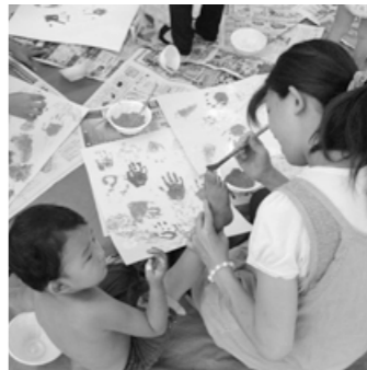
▲こんどは足形をとろうネ

第5回学級会では、専用の絵の具を手や体につけて遊ぶポスターペインティングを楽しみました。紙に手形をつけたり、筆を使って自分で体に色を塗ったりしました。真夏の空の下、親子でふれあい、会話をし、のびのびとした活動になりました。