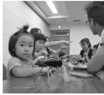
▲盆飾りの「馬」を作りました

親子体験教室の「オケラとかかしと麦わらぼうし」では、4月に植え付けたジャガイモやニンジンが見事に育ち、参加者（7組23人）で収穫体験をしました。また、跡地にソバの種を蒔きました。続いて、村民会館調理室にて採れたての野菜を使ったニンジンジュースやポテトチップス作りに挑戦しました。