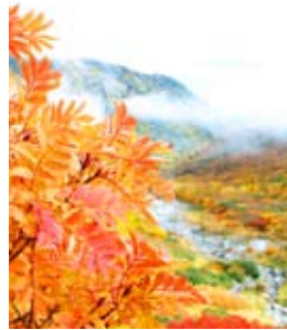
紅葉お勧めスポットは濃ヶ池へ向かう途中にも

中央アルプスの主峰駒ヶ岳（標高2956m）から北へ続く細い尾根「馬の背」の眼下に位置する濃ヶ池。