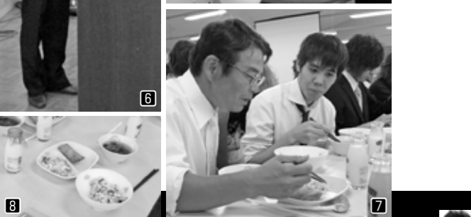
4昼食会で恩師があいさつに立つと視線が一齐に先生に向けられる 5自分たちで盛り付け「なつかし〜い」 6当時の給食委員長さんが当時と同じように 7恩師に近況報告？進路相談？ 8人気メニューを再現