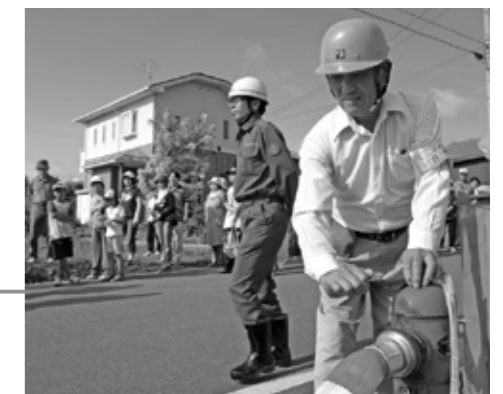
地震防災訓練 8月29日

中学2年生が自分で選んだ村内外の事業所に分かれて2日間の実習をしました。（関連記事：10頁）