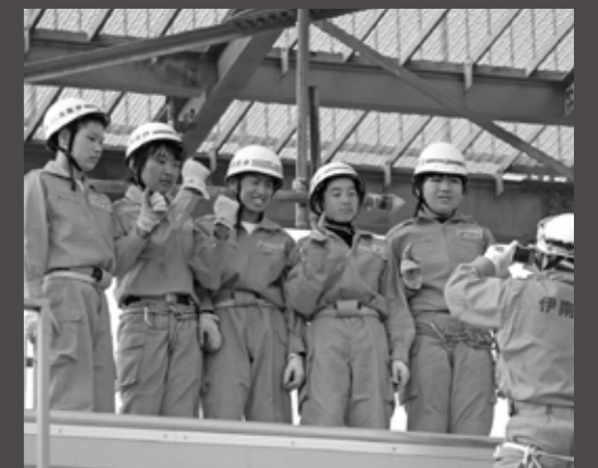
“要救助者”の待っている向こう岸へ全員が無事渡りきって安堵のピース!

宮田中2年生の職業体験実習(8月25日)自分で選んだ職場で実際に働き、職業について考える「職業体験実習」。表紙は消防署での「救助訓練」。緊張感が伝わってきました。【関連記事 8・10頁】