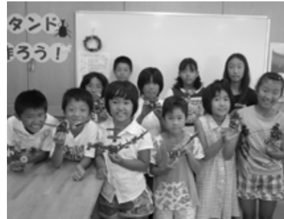
▲世界に一つだけの写真立て♪