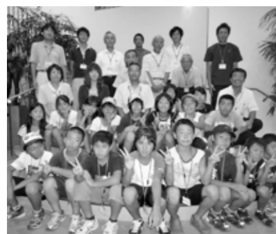
▲参加した18人の子どもたちとスタッフ

子どもたちにとって、家庭を離れた2泊3日は、大変意義深い体験の連続だったようです。特に食事については、献立を考え、買い物をし、調理をしなけ