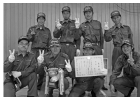
ラッパ吹奏大会 優勝 第2分団

消防技術の向上と、士気の高揚を目的に毎年この時期に開催されているこの大会。全員がひとつの目標に向かって取り組むことで、チームワークの向上にもつながっています。