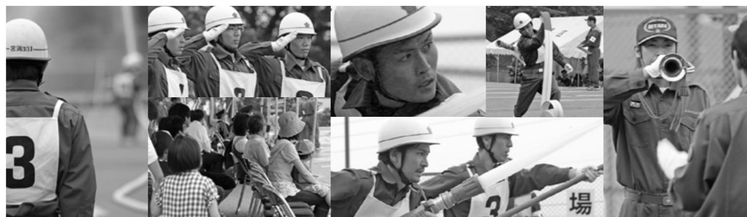
真剣な表情で大会に臨む団員たち。子どもを連れた家族など大勢の観客で賑わった。