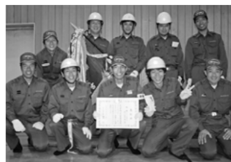
ポンプ車操法の部 優勝 第2分団 第3部 (河原町)