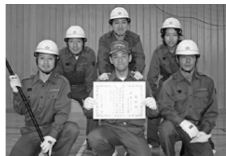
小型ポンプ操法の部 優勝 第3分団 第5部 (大原)