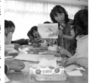
▲墨の濃淡が大切なヨ。

水墨画は、東洋独自の絵画形式で、原点は書道と同じなのです。墨と紙と筆の性質を、限られた期間の中で理解する事はとても難しいと思いますが、楽し