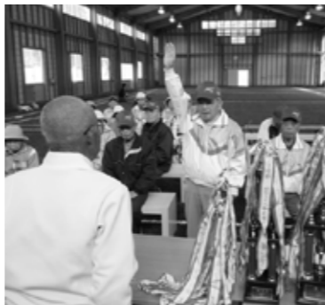
▲ゲートボール開幕式

4月26日、子育て学級の開講式が行われました。今年度は52組の参加で、毎月1回計12回の学級会が予定されています。開講式に続いて第1回学級会では、8グループに分かれ、自己紹介をしたり、連絡員を決めたりと、和やかに笑顔あふれる学級のスタートになりました。