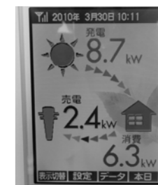
センター内のモニター