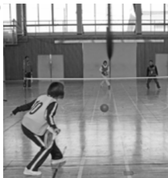
▲ふわっとテニス開講

4月5日、子どもから大人まで幅広い愛好者が集う新スポーツのふわっとテニス。今年も初心者を合わせて24名が集まり、開講式を行いました。班編成の後、さつきゲームを楽しみました。