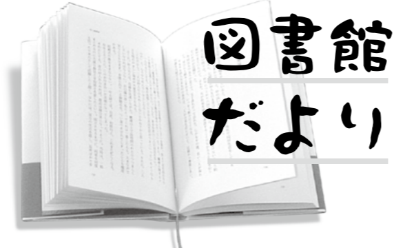
宮田村図書館 ☎ 85-2314 (村民会館内)