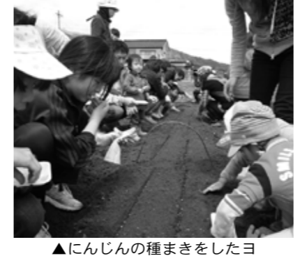
▲にんじんの種まきをしたヨ

親子農業体験教室として、今年も多くの親子が集まり、4月24日、専用の畑で開講式が開かれました。豊かな自然の中で地域の人々との触れ合いや物の大切さ、食の大切さ、命の大切さなど豊かな情操を育むことができる講座として、年々活動が活発になってきており、今年も年8回を予定しております。開講式後、全員で「じゃがいも」を植え、「ニンジン」と「二十日大根」の種まきをしました。参加者は、自分の菜園を決めて立て札を立て、収穫を夢見て楽しんで体験活動を進めました。