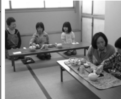
▲「お茶と礼儀作法」を学びます

小中学生を対象にした学校週5日制対応講座が始まりました。ボランティアの方々を講師として、左記のような10講座があります。村民会館、なごみ家、体育センターなどを会場にして、総数120人ほどが土曜日に楽しく活動しています。