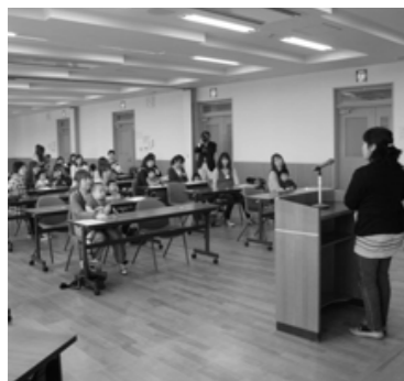
▲子育て学級の開講式

4月13日、4チーム27人の会員は、高齢者等元気空間施設としてリニューアルされた屋内運動場の改修竣工式に臨み、その後、今年度のリーグ戦の開幕式を行いました。そして、緑の人工芝に白線が映える新しいコートで、一打一打その感触を確かめながら