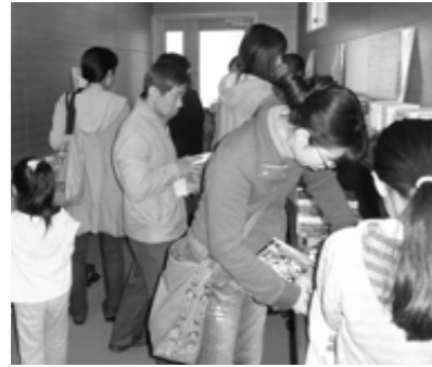
▲お気に入りの一冊を Get!