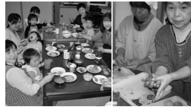
▲みんなで作った草もちおいしいよ ▲あんこがはみ出ないように

4月22日(木)、草もちを作りました。当日は、赤ちゃんを連れてた若いおかあさん達や、初めてなごみ家に来た方など、30名の参加がありました。草もちは、米粉と地粉を練り、蒸して、よもぎを混ぜ込み、あんこ、きなこをつけて、いただきました。