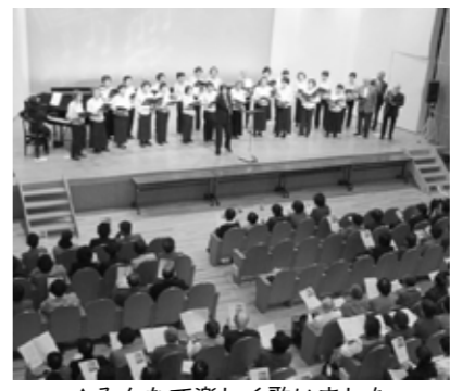
▲みんなで楽しく歌いました

のチャイムが鳴ると一目散にお客様がけて突進します。犬嫌いな方は脅えてしまいます。でも、大きな瞳と、愛嬌のある曲がったしっぽがかわいいため言ってくれます。毎朝散歩に連れて行ってくださる主人と、ご飯とおやつをくれる私をご主人様と思っているようです。また、仕事から帰って来て遊んでくれる長男と、日中