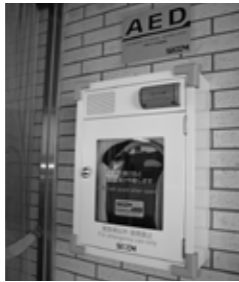
▲役場正面玄関の風除室内に設置してあります。

AED（自動体外式除細動器）は、心臓に電気ショックを与え心臓の動きを戻すようにするもので、一般の人でも機械の解析と案内に従って操作することが出来ます。