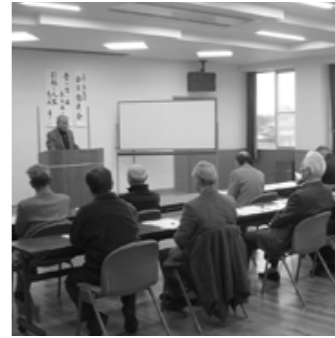
▲人生を振り返りながら

「こんにちは」と元気よく来ると早速適当な相手を見つけてパチリパチリ。「家でお父さんに指し方を教わった。」と披露してくれる時もあります。将棋の好きな小中学生20人が毎回楽しみに集い、熱中している姿は大変ほほえましく、頼もしく感じています。