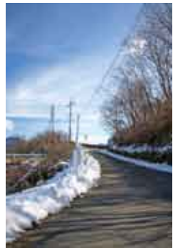
国道方面へ向かって 駒ヶ原の段丘を上がつ ていく『むじな坂』

宮田村を南北に貫いていた江戸時代の伊那街道は、現在でも所々でその名残りを認めることができます。駒ヶ原の段丘へと上る「むじな坂」もそのひとつです。