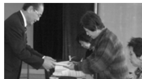
▲発足式で委嘱状を受け取る保健補導員のみなさん

平成22年 保健補導員を紹介します 保健補導員とは区の役員として各区より選出され、「自分達の健康は自分で守りましょう」をスローガンに活動しています。今年は15人の方が新しく選出され、合計31人で活動が始まりました。 介助などいろいろな保健事業のお手伝いも行っています。地区の保健補導員さんがお宅にお邪魔することもありますが、思いますのでよろしくお願ひします。 保健補導員にはOB会もあります 保健補導員活動を終了した方は、保健補導員OBとして学習活動や保健補導員活動にご協力いただいています。その数は500人以上になり強力な協