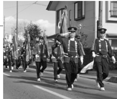
◀昨年に続いて子ども隊もパレードに参加。先頭を行進したあとは、後ろからくる団員たちや消防車に手を振って声援を送りました。