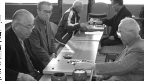
▲交流を深めながら囲碁の対局