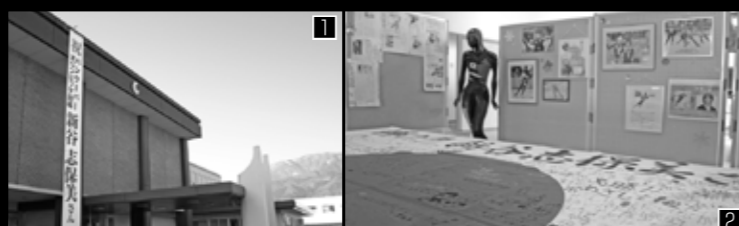
1 役場庁舎の大型垂れ幕 2 村民会館の新谷選手応援コーナー 3 4 後輩たちが活躍を願って千羽鶴