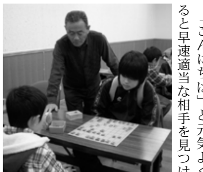
▲将棋の奥深さを学んでいます

は、抹茶を点てる実技を通して、日本の伝統文化を学びました。学校週5日制対応講座(5)