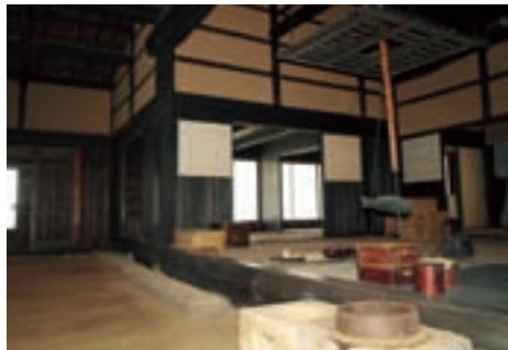
母屋の土間と台所 当時の生活がうかがえる

本陣のあった宮田宿は、現在の旧道白心寺入口の付近から北へ300メートル、北町交差点付近までの区間で、太田切川の渡し場を控えた交通の要所として、賑わっていたといわれています。道路の中央には水路が流れていて、飲用水や馬の飲み水、そして防火用水に使われていました。移築した本陣の前にも、水路のある街道が復元されていて、当時をイメージすることが出来ます。今もこんな街並みがあれば素敵ですね。(2008年6月号より)