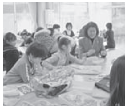
▲「やさしい手芸」の活動の様子

小中学生を対象にした学校週5日制対応講座が始まりました。今年度は左記表の通り9講座が開設されています。地域のボランティアの方々を講師として、村民会館、なごみ家、体育センターなどを会場に、総数120人ほどが土曜日に楽しく活動しています。村の文化祭へ作品を展示するグループもあり