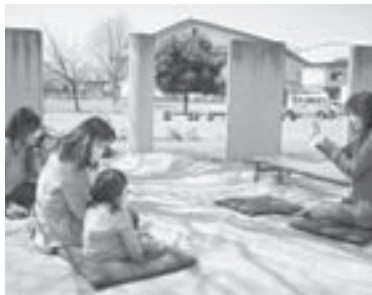
▲親子で楽しいひととき♪

春のさわやかな風の中、4月のおはなし会「ひよこのひろば」が屋外読書広場で行われ、おはなしの空間を満喫しました。