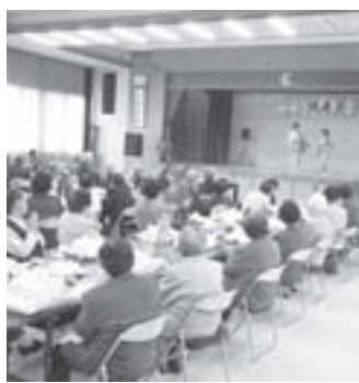
▲日舞「長良川艶歌」を楽しむ

新田分館では4月24日、文化会館にて敬老会を開催しました。区内より61人が参加し、式典後小学生の歌や作文、花束贈呈に