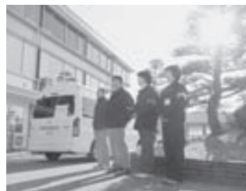
▲駒ヶ根市役所前での出発式の様子