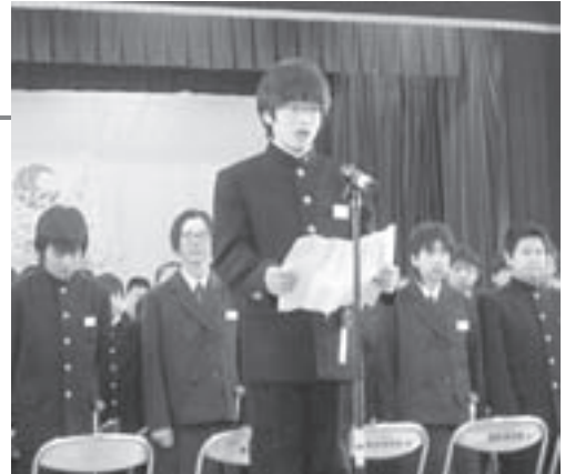
▲新入生代表あいさつ