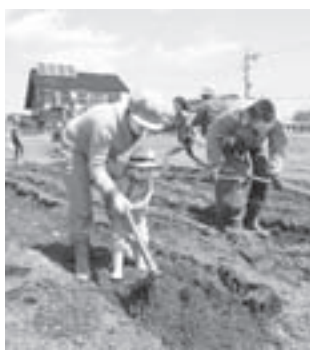
▲みんなで「ジャガイモ」植え

式後、全員で「じゃがいも」を植え、「ニンジン」や「二十日大根」の種まきをしました。