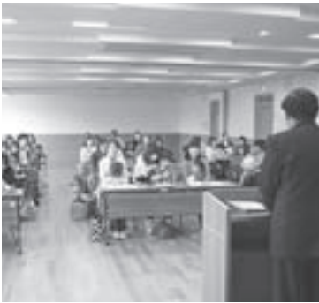
▲子育て学級の開講式

開講式に続いての学級会では、各グループに分かれ、自己紹介をし、正副学級長や連絡員を決めました。話が進むにつれ、お母さん方の緊張もほぐれて笑顔が広がり、あたたかな雰囲気スタートになりました。