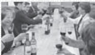
▲さっそく『紫輝』をテイスティング

5月中であれば追加募集にも対応します。 興味を持たれた方、公民館へご連絡ください。