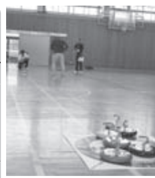
▲「カローリング」を学びました

7月13日、スポーツ推進委員会では、体育センターでニユースポーツ体験研修会を開きました。たくさんさんのニユースポーツがありますが、公民館に揃っている幾つかのスポーツの中から「囲碁ボール」「カローリング」「デイスゲッター」についてルールや競技方法を学び合いました。「誰でも、どこでも、気軽にスポーツができる」ことを実感できた研修会でした。