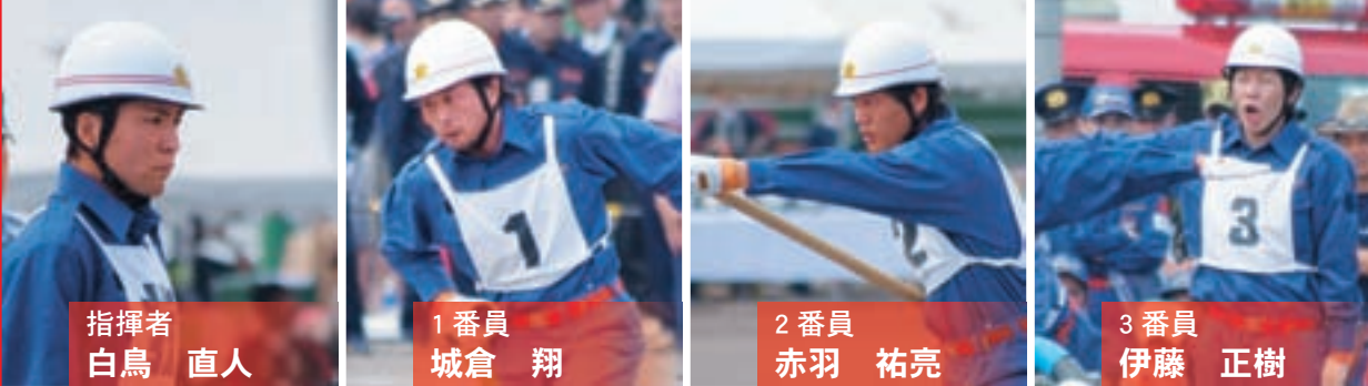
指揮者 白鳥 直人