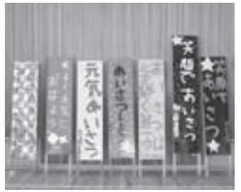
▲完成したあいさつ看板