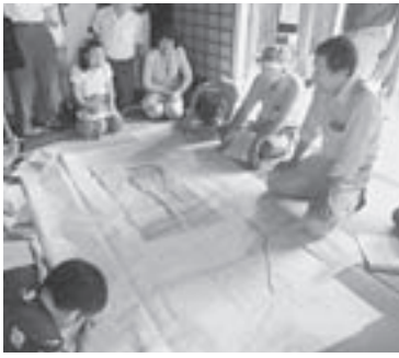
▲地図に移して宮田宿の歴史を学びました

宿に至る水路の分岐点には、古い家が存在する点や大正時代に建てられた青年会の道標の分布が、駒ヶ原開発や街づくりプランとの関係性を示唆していることでした。 講演に続いて、「機械を使わずに、木の高さや川の幅を測る」体験学習に入りました。実測するのが困難な高さや長さ等を測