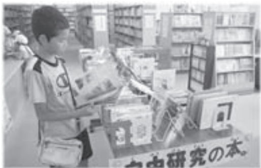
▲さて、何にしようかな