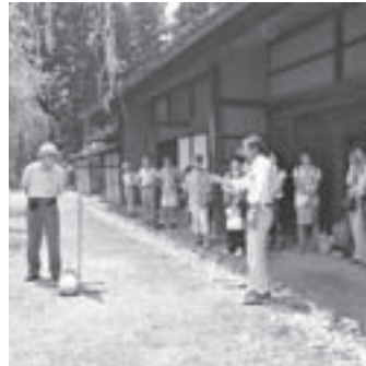
▲長さや高さを測る体験学習

宿に至る水路の分岐点には、古い家が存在する点や大正時代に建てられた青年会の道標の分布が、駒ヶ原開発や街づくりプランとの関係性を示唆していることでした。 講演に続いて、「機械を使わずに、木の高さや川の幅を測る」体験学習に入りました。実測するのが困難な高さや長さ等を測