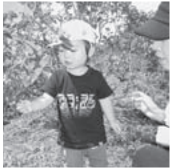
▲ブルーベリーっておいしいネ