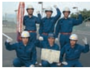
ポンプ車操法の部 優勝 第2分団第3部