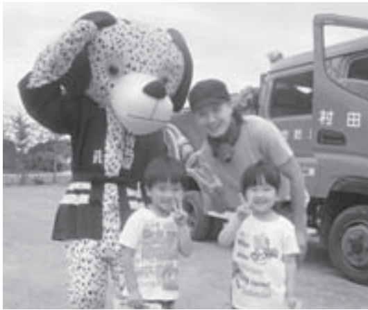
▲消防団キャラクター「ダル君」と一緒に