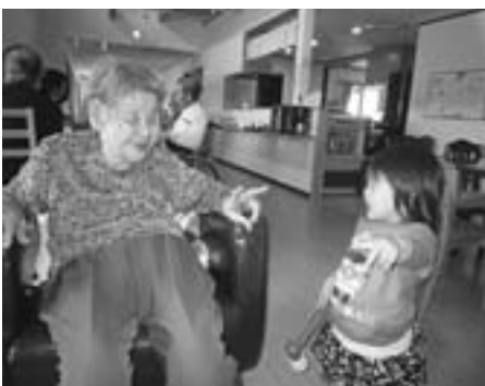
閩宅幼老所あずま家

私たちは『その人がその人らしく生き抜く』事のサポートをさせていただきます。と考えております。