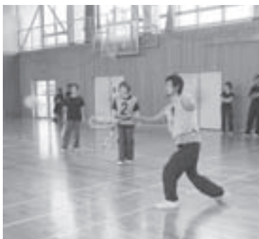
▲ペアの息もぴったり！