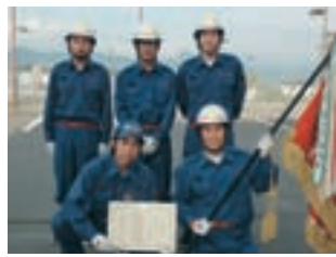
小型ポンプ操法の部 優勝 第1分団第2部