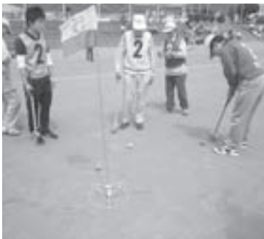
▲この1打でゴールだけ！