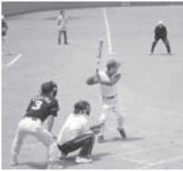
▲ナイスバッティング…