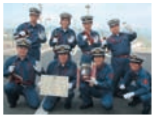
ラッパ吹奏の部 優勝 第2分団