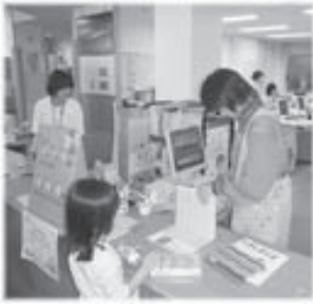
▲カウンターでの一コマ

5月下旬、前週の宮田中学校に続いて赤穂中学校生徒3人が3日間の職場体験学習に来館しました。初日は遊ゆう広場のおはなし会に参加して親子との交流を図りました。また、図書館では、資料の返却・貸出し・整理等の仕事を丁寧に実施し、利用者の方々からも温かく接していただきました。ありがとうございました。