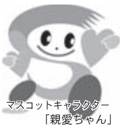
マスコットキャラクター「親愛ちゃん」