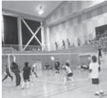
▲このボール、絶対に返すヨ…

農業者トレーニンングセンターでは、バレーボールが行われました。2コートで熱戦が展開され、どの試合も元気な掛け声と共に、ラリーが続いていました。