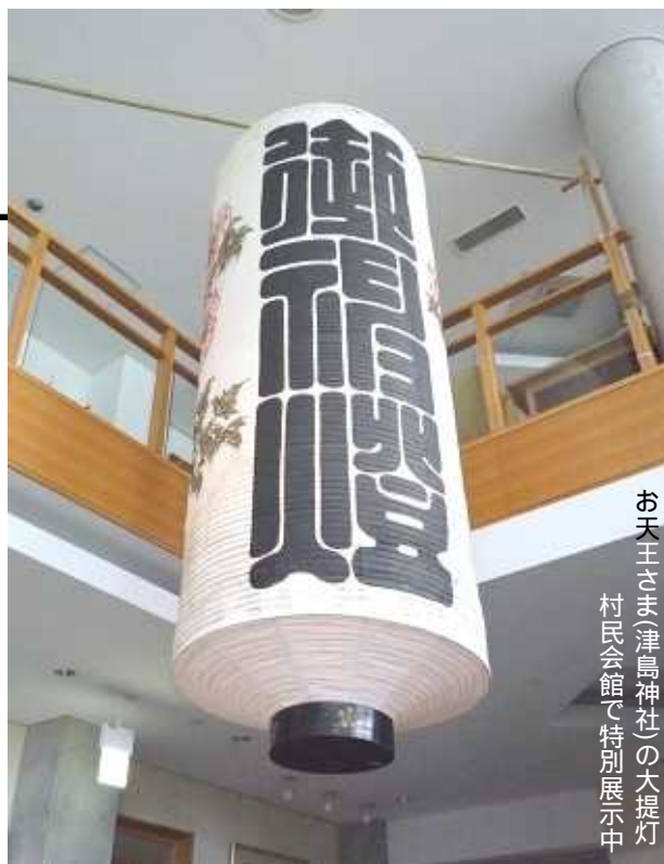
お天王さま(津島神社)の大提灯 村民会館で特別展示中

ということで、教育委員会と宮田小学校と公民館が中心となり、8月から9月にかけて、今年度が第1回目の合宿としてスタートします。合宿参加する対象は小学4～6年生です。もう参加締め切りしてしまいましたので、これから申込みということはできませんが、子どもたちがさらなる自分みがきにチャレンジします。そんな活動に来年はぜひ参加してみませんか？