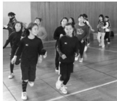
▲ランニングで体をほぐして