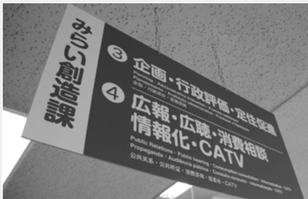
役場正面入口に入って左側 住民課と総務課の間にあります

役場の組織の変更が4月1日に行われ、新しく「みらい創造課」が創設されました。担当する業務 村の政策推進の基となる基本計画をはじめとする各種政策の策定や、広報みやだ、ケーブルテレビなどを使った情報発信業務など、これまで総務課企画情報係で行っていた業務に加え、住民課環境係で行っていた地球温暖化防止対策業務などがおもな業務です。 また、これに伴って、住民課環境係は廃止され、ごみ処理や公害、犬の登録などの業