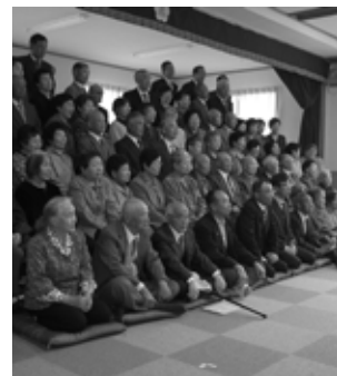
▲67人参加の新田敬老会