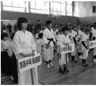
▲選手・監督・コーチ 150人集合

4月5日、体育センターに10のスポーツ・文化団体が集結し、激励会が行われました。選手120人、監督コーチ保護者30人程が集まり、「笑顔で参加しよう。大きな声であいさつしよう。元気なかけ声を出し合おう。ルールを守ろう。強い心を育てよう。」の合言葉を全員で力強く唱和し、今年の活躍を誓い合いました。