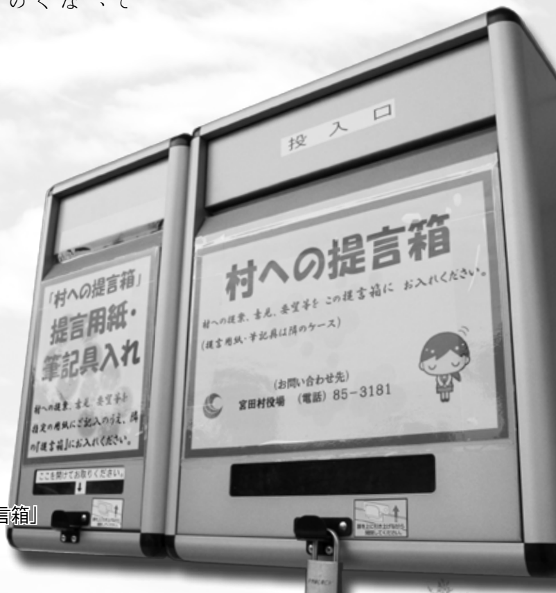
拠点施設に設置されている「提言箱」

ご自宅で記入する際にご利用ください。記入後は、お近くの提言箱へご投かんください。質問やご意見、ご要望などお気軽にお寄せください！