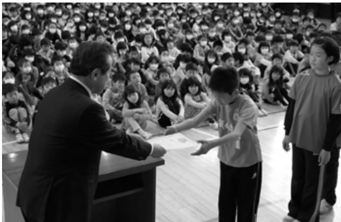
小田切村長から任命書を受け取る代表の子どもたち

“緑のカーテン”などとも呼ばれています。窓面に張ったネットなどに植物（ツルのあるアサガオやゴーヤなどが人気です）をはわせることで、日光が直接室内に入ることを防ぎます。植物は吸収した水分を葉から蒸発させているので、よしずなどで日を遮るよりも温度を下げる効果が高いといわれています。また、窓辺に緑が揺れ、視覚的にも爽やかな感じがします。