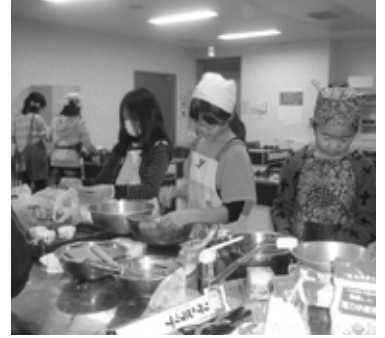
▲手際よくお菓子作り

小中学校生を対象にした「学校週5日制対応講座」が始まりました。今年度は、お手玉で遊ぶ講座が加わり、12の講座が開設されます。月1回、村民会館やなごみ家、体育センターに集まり、総勢で約130人が学ぶことになっています。