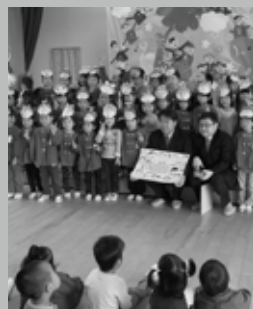
寄贈のカメラを使って さっそく記念撮影

オリンパス労組から西保育園にデジタルカメラ1台を寄付していただきました。4月22日に西保育園で贈呈式が行われ、同組合役員からカメラが園児に手渡されたあと、園児たちはみんな歌を歌ってお礼をしました。ありがとうございます。