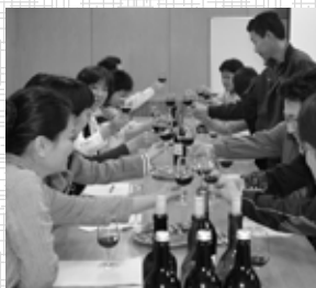
さっそく「テイस्टィング」 (ベーシックコース 初回講座)