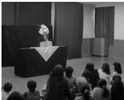
▲「さんびきのこぶた」より