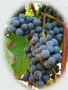
ヤマソービニオン