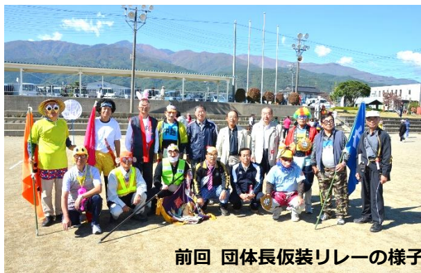
前回 団体長仮装リレーの様子

村民誰でも参加できます！参加をご希望の方は、各地区分館役員へお問い合わせください。連絡先が分からない場合は公民館までご連絡ください。