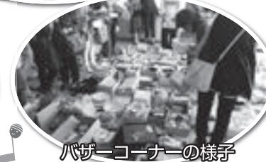
バザーコーナーの様子