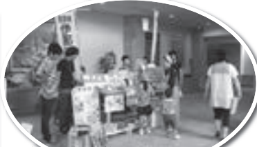
伊那看護学校展示コーナー