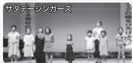
サタデーシンガーズ