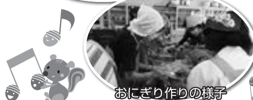
おにぎり作りの様子