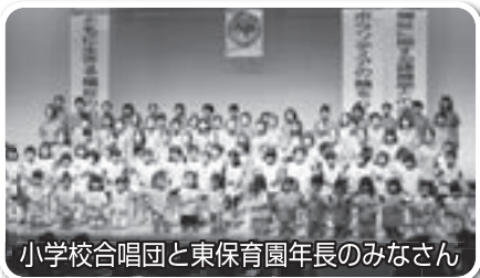
小学校合唱団と東保育園年長のみなさん