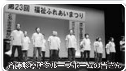
斎藤診療所グループホームの皆さん