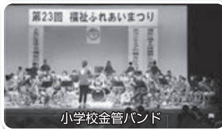
小学校金管バンド