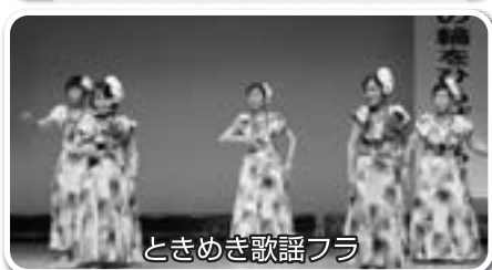
ときめき歌謡フラ