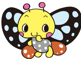
まだらくん・あさぎちゃん [アサギマダラの里イメージキャラクター]