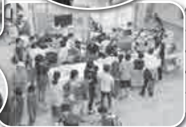
ご来場ありがとうございました。