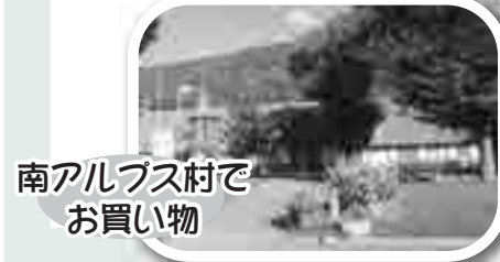
南アルプス村でお買い物