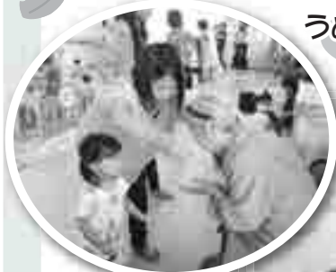
うめっ子らんど見学