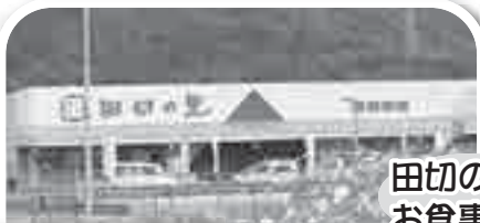
田切の里でお食事モ!