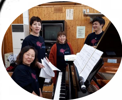
今日は MMC の4人のメンバーが支援です