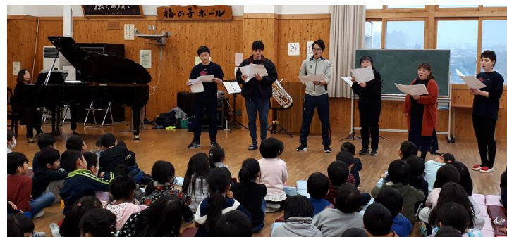
先生たちも「旅立ちの日に」を熱唱