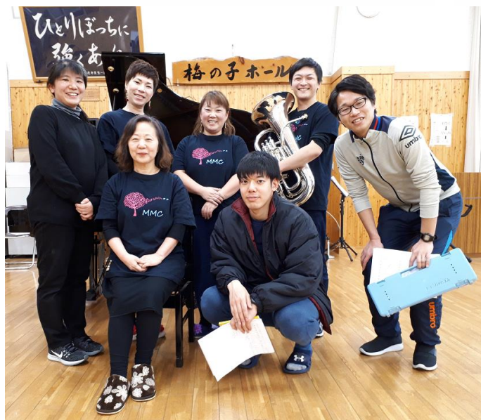
おそろいのTシャツを着た MMC の皆さんと先生たち

1年生に「MMC」の皆さんが音楽の指導をしていただくのも、今日が最後。これまで歌や鍵盤ハーモニカの指導や、音楽会の発表に向けて集中指導もしていただきました。