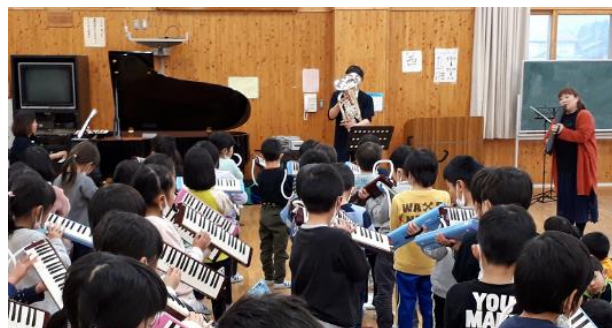
ユーフォニアムの演奏に合わせて、子どもたちがピアノを演奏