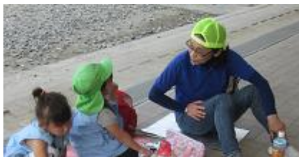
おいしいお弁当を広げていっぱいお話しましたね