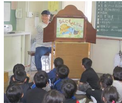
今年度初回、自己紹介する「まほうのクレヨン」と「おはなし宅Q便」の皆さん