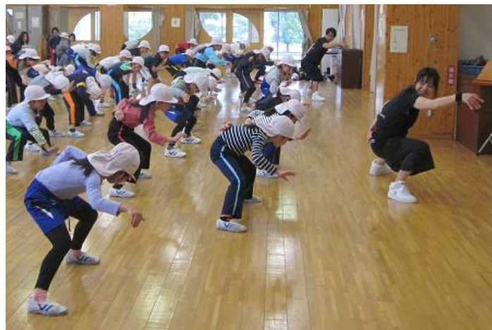
腰を低くするのは大変...