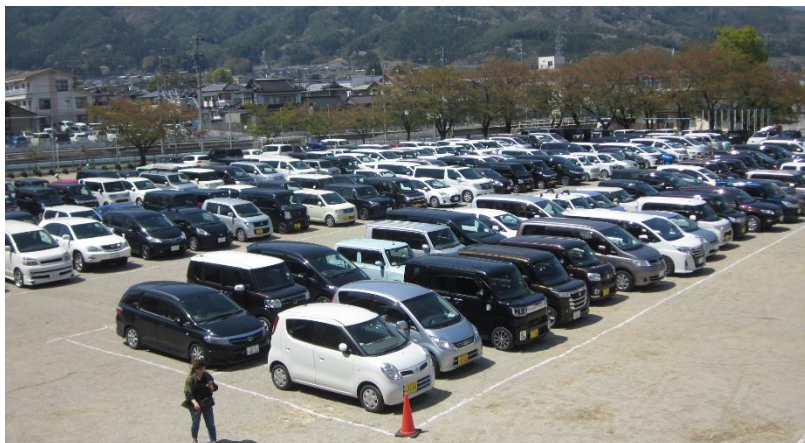
整然と並んだクルマ、さすがです

春の強い日差しの中、「おやし道場」の方たちが、小学校の運動場で駐車場の整理をしてくださいました。保護者会に参加する皆さんの車を、運動場に整然と並べるには、技が必要です。次々と入ってくる何百台もの車を手際よく誘導するおやし道場の方々。