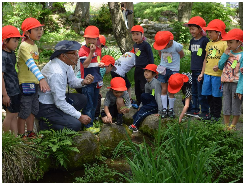
「これはセリ。食べられるよ」といわれ みんなも口に入れると、「ウ、ニガイ！」