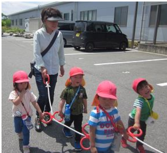
暑い中、ニコニコ笑顔で歩く子どもたちとうめっこ育て隊の皆さん